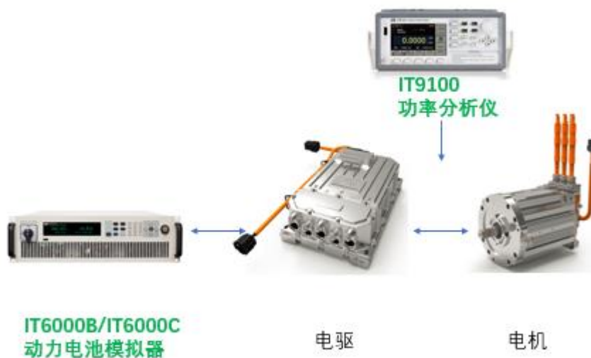
电动车电驱电机测试

在电动汽车的电机及电驱测试中，需要使用直流电源替代动力电池进行供电，这个直流电源应具有内阻可调、可以双向工作的能力，且最好能够模拟实际的动力电池性能参数。艾德克斯为此提供高性能的解决方案。